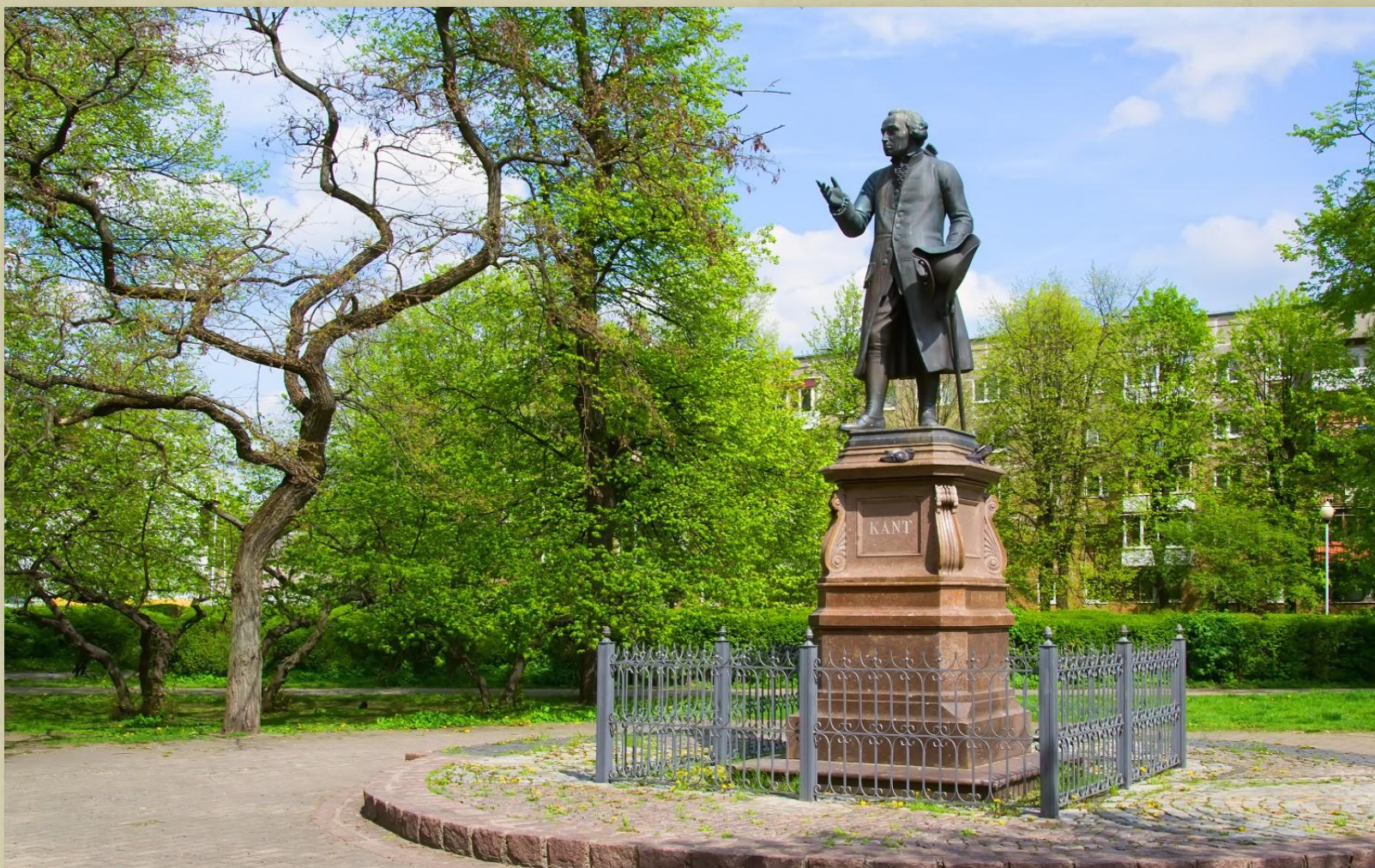
Памятник Иммануилу Канту на Университетской площади в Калининграде.