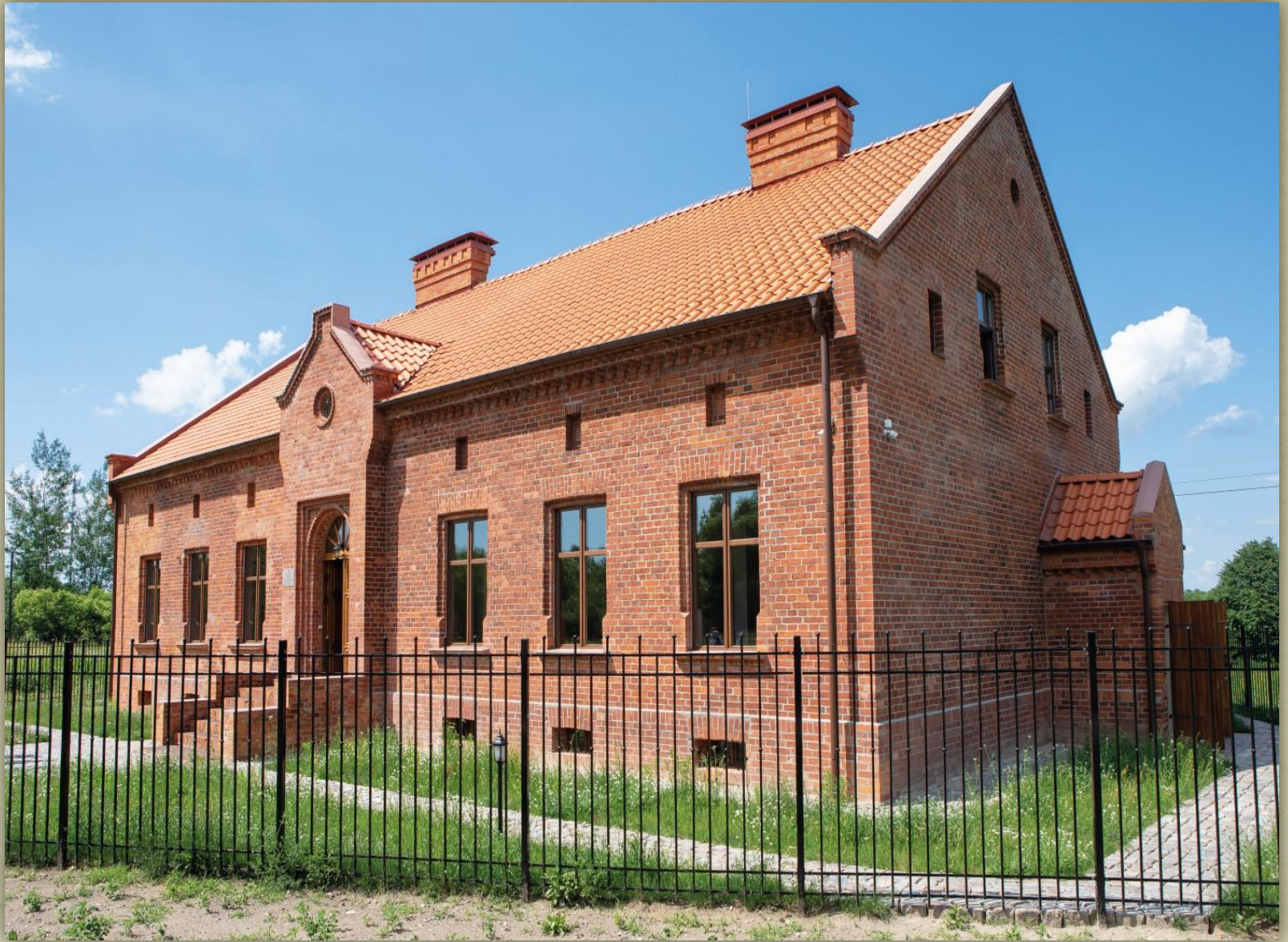
Дом, в котором жил И. Кант.